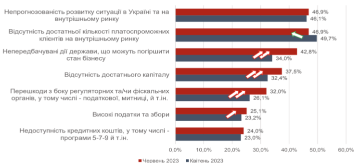
Рис. 1. Перелік основних проблем бізнесу за результатами опитування 2023 р. [3]

6. Погіршення інвестиційного клімату. Війна породжує невизначеність та значні ризики, що відлякують потенційних інвесторів. Невизначеність щодо тривалості і результатів війни ускладнює прогнозування ринкових умов та можливостей для бізнесу. Відомо, що такі часи часто супроводжуються великими економічними труднощами, валютними коливаннями та змінами в законодавстві, що ще більше збільшує ризики для інвесторів [14].