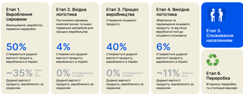
Рис. 3. Життєвий цикл товарів, вироблених в Україні і за кордоном [13]

Усі українці щодня купують ті чи ті товари, навіть під час війни. Проте кожна витрачена гривня може мати ще більший вплив, оскільки при покупці українських товарів у середньому до 40 % вартості повертається до державного бюджету, що створює додаткові можливості для підтримки наших міст, наших громадян і тих, хто гарантує безпеку нашій країні щодня на лінії фронту. Порівняння життєвих циклів товарів, вироблених товарів в Україні та за кордоном відображено, на рис. 3 [13].